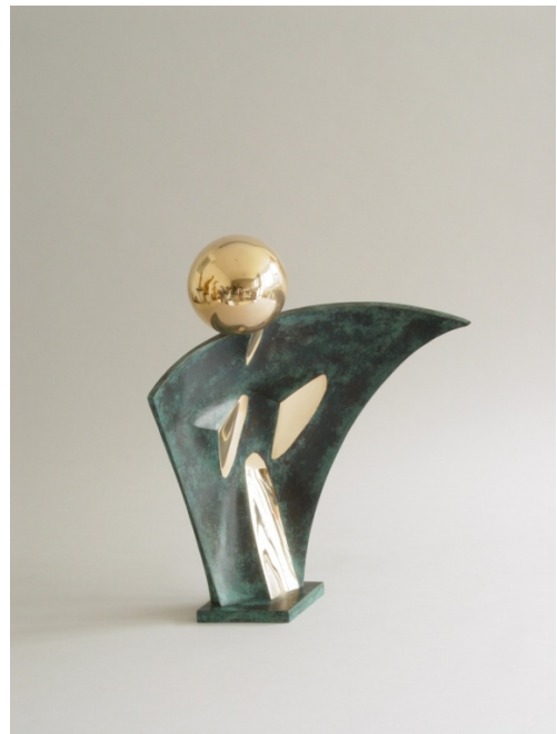
La grande madre