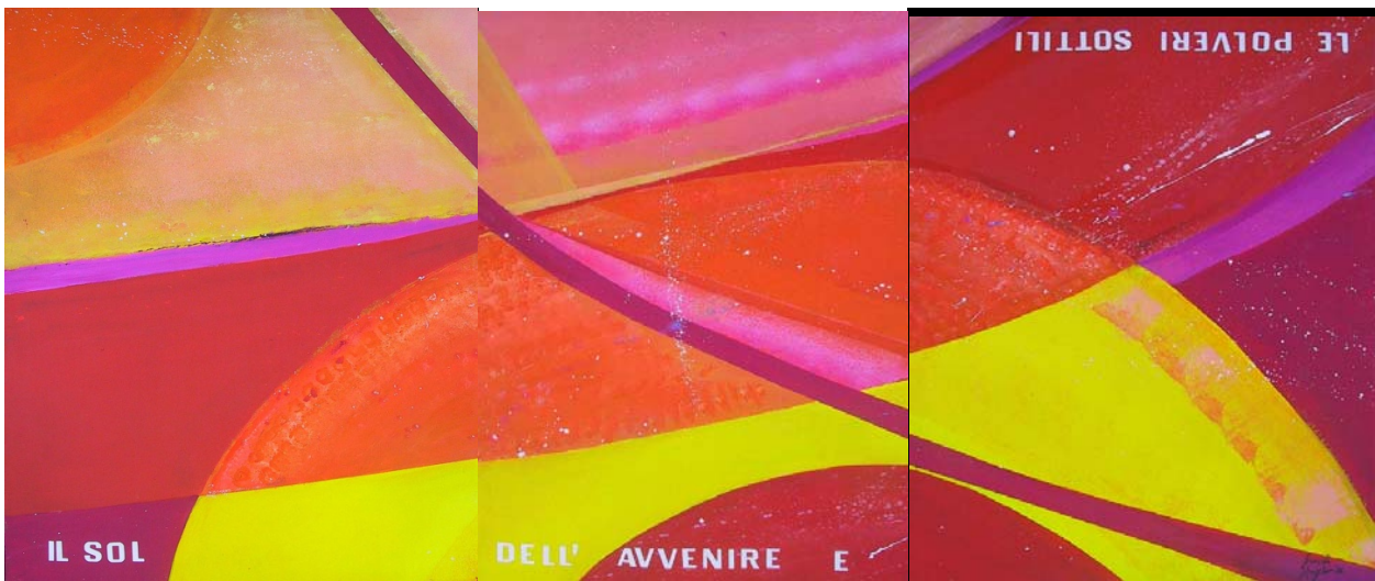
Il sol dell'avvenire e polveri sottili