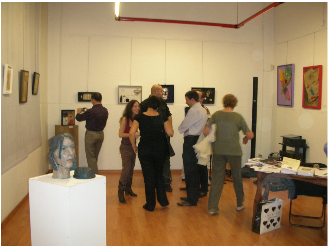
Alcuni momenti dell'inaugurazione