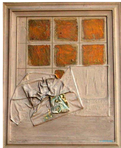
ricordi di cascina