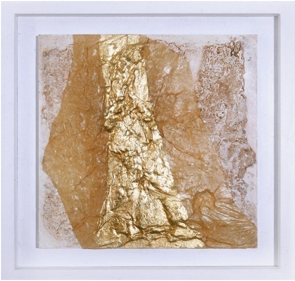
Onda in piena