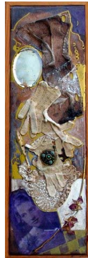
ricordi di una vecchia signora