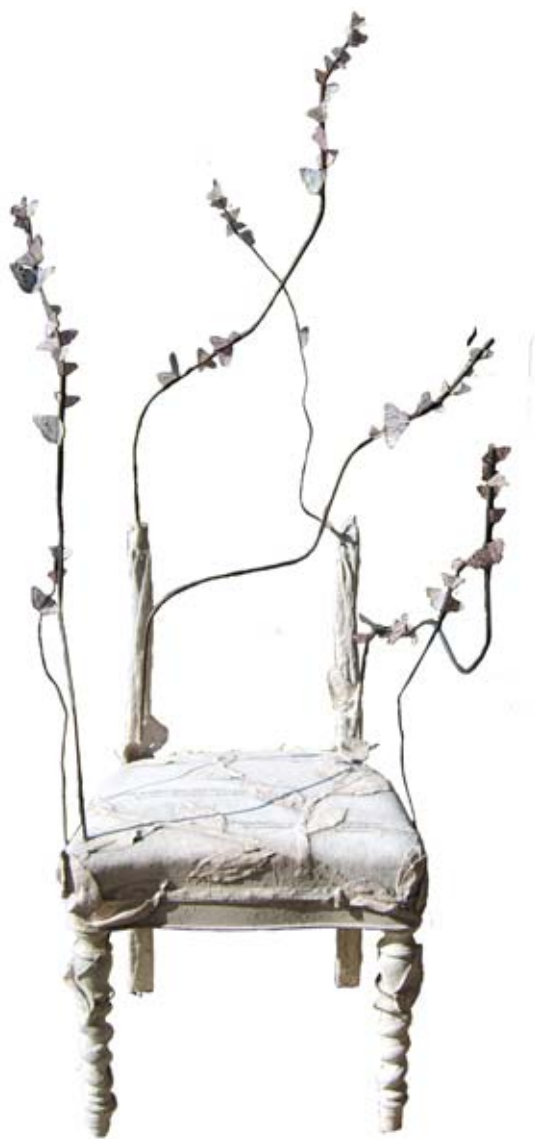
Quante Farfalle – Sedia d'Artista