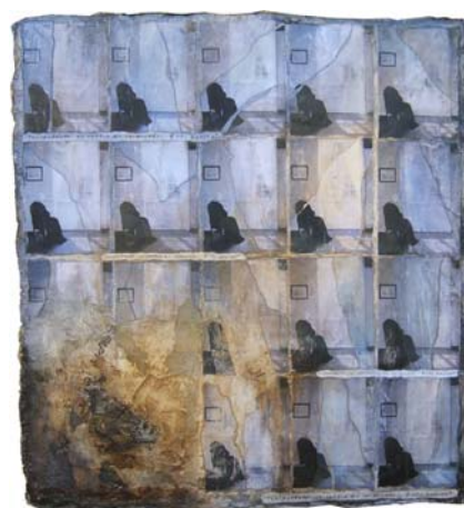
Un soffio mi sorprende