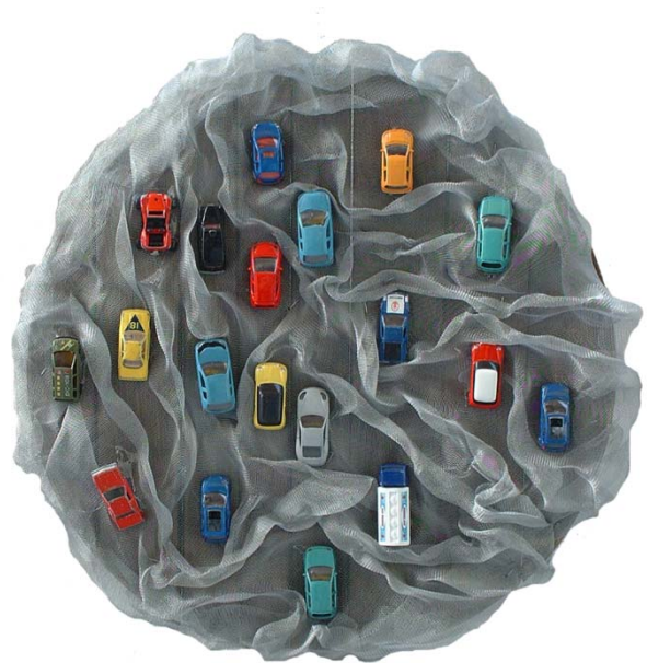
MI - VE