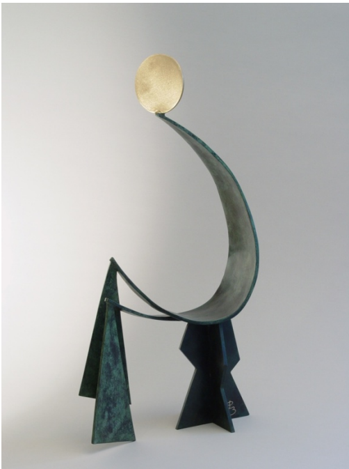
E non aspetto nessuno